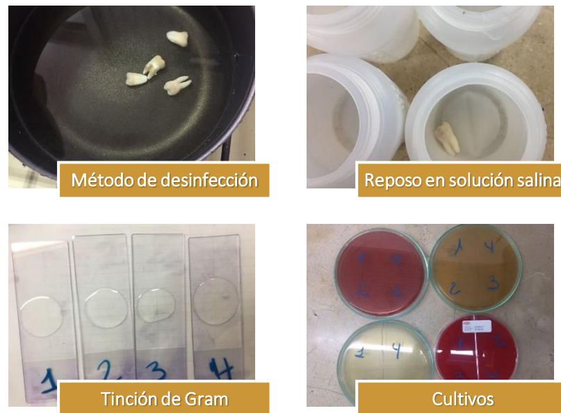
Figura 1. Procedimiento de la prueba piloto

diferentes. El procedimiento se lo aprecia en la Figura 1.