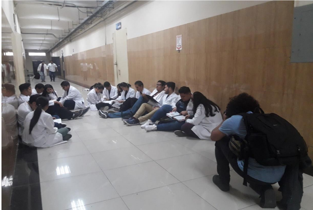
Recorriendo la Universidad de Guayaquil, facultad de Medicina.