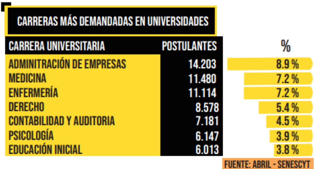
Carreras más demandadas en universidades públicas