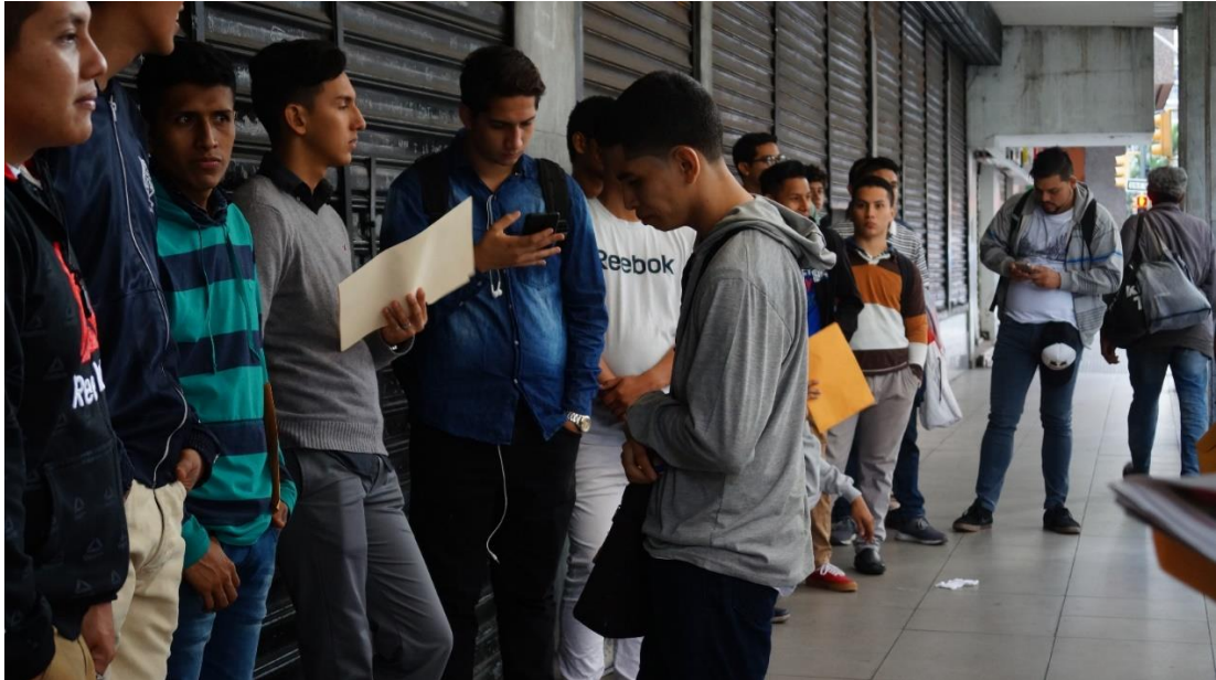
Scouting para fotos de desempleados, en la calle Vélez y 9 de octubre en Guayaquil a las 08:45