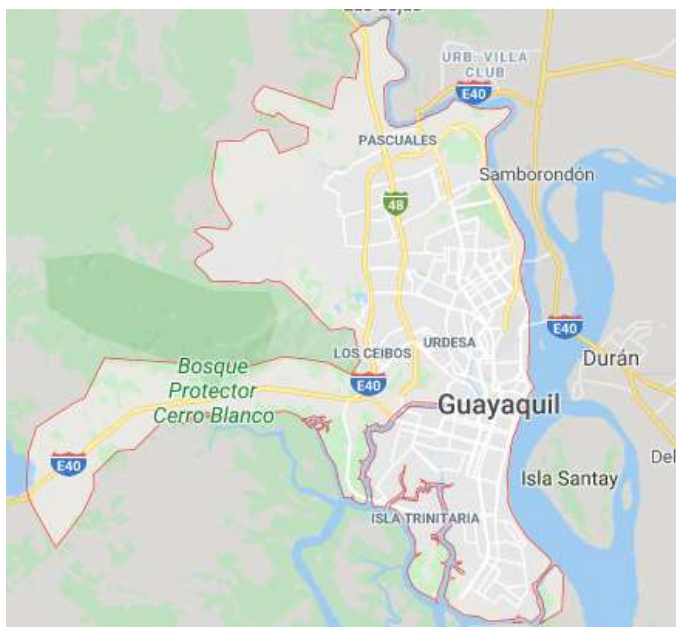
Gráfico 1: Urdesa en Guayaquil-Ecuador

La descripción del vínculo humano-animal en adultos de la ciudad de Guayaquil – Ecuador se realizará el cuestionario a los propietarios de perros. De acuerdo con el Instituto Nacional de Estadística y Censos (INEC) (2020), en el censo del año 2010 se contabilizó en Guayaquil una población de 2.350.915 habitantes.