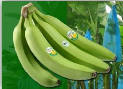
Ilustración 3. Banano orgánico Cavendish 40 lbs.

Carga Común: 1080 cajas en 20 pallets (54 cajas/ pallet)