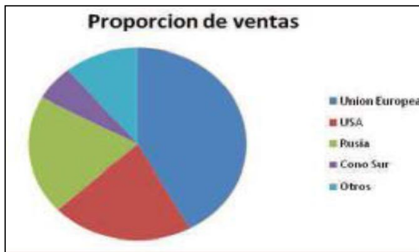
Ilustración 2. Proporción de las ventas del mercado ecuatoriano