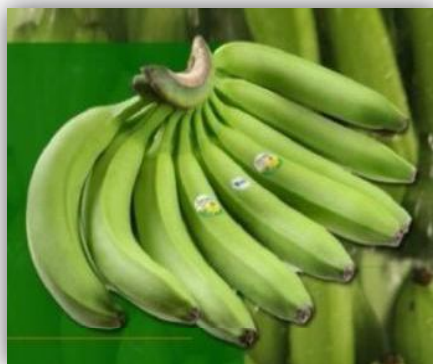
Ilustración 4. Banano orgánico Cavendish 28.6 lbs.