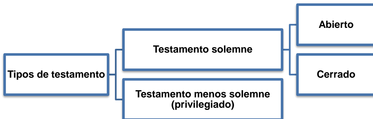
Tabla 1. Tipos de testamento