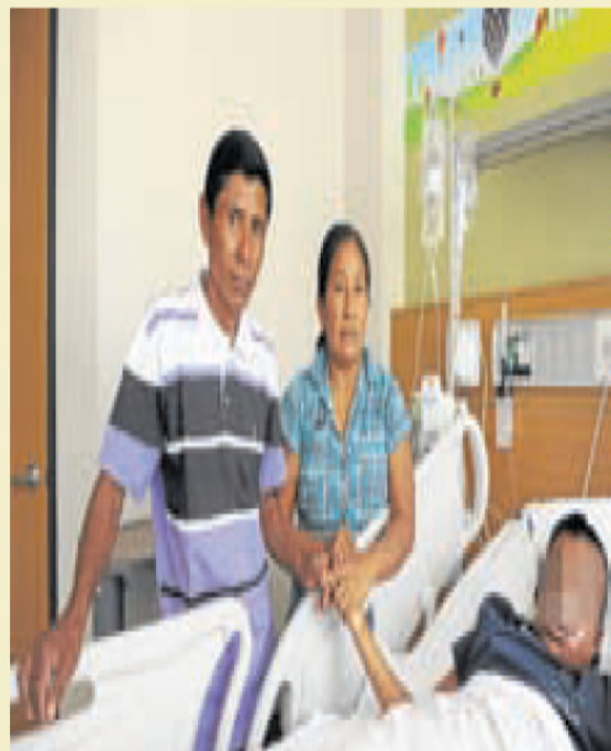
PLUAR GACERES TEL TELEGRAFO