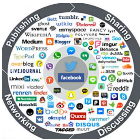
Figura 1. Panorama de las Redes Sociales

Se lo define de una manera más sistemática, como los elementos del universo que conforma el ciberespacio, son plataformas o aplicaciones en la web que “permiten la creación e intercambio de contenido generado por los usuarios” (Kaplan & Haenlein, 2010), además de ofrecer la facilidad para mantenerse en contacto y relacionarse; “una particularidad de las redes sociales es que permiten al usuario la construcción de un perfil público o semipúblico dentro de sus servidores” posibilitando gestionar el contenido, lista de contactos y herramientas de personalización (Bold & Ellison, 2007).