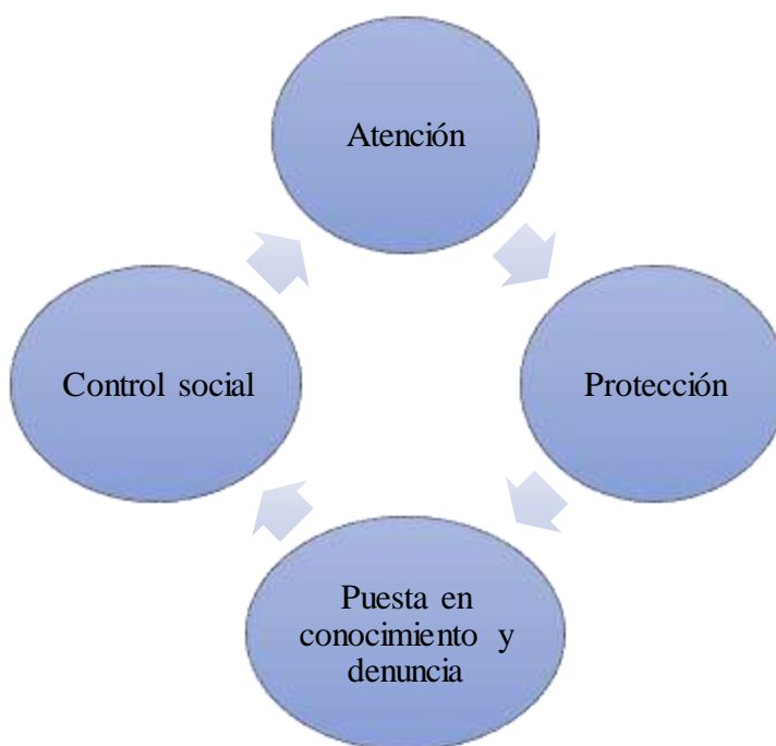
Figura 3. Acciones de respuesta a un caso de maltrato

La problemática jurídica se basa en la forma de prevención y tratamiento del ciberbullyng, pero esto al no estar tipificado, no se determina una forma de prevención efectiva, que por el contrario en función de un modo de respuesta de las unidades y organismos anteriormente señalados, se encuentra las obligaciones de dichos organismos para atender de manera inmediata y oportuna, ante cualquier tipo de violencia o maltrato, ya que en el Artículo 35, de la Constitución de la República del Ecuador (CRE, 2008), se indica que: el “Estado prestará especial protección, si NNA se encuentran en condición de múltiple vulnerabilidad”. A continuación, se representa las cuatro obligaciones de una persona que identifica un caso de vulneración de derechos de NNA.