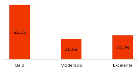
Gráfico 3. Nivel de conocimientos de los alumnos