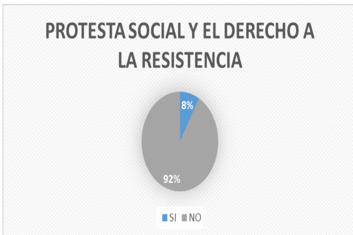
Grafica #2: Actos de manifestaciones