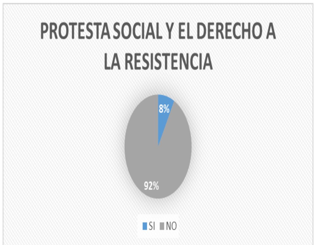
Grafica #1: Protesta Social