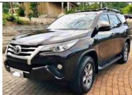
Vehículo Toyota Fortuner