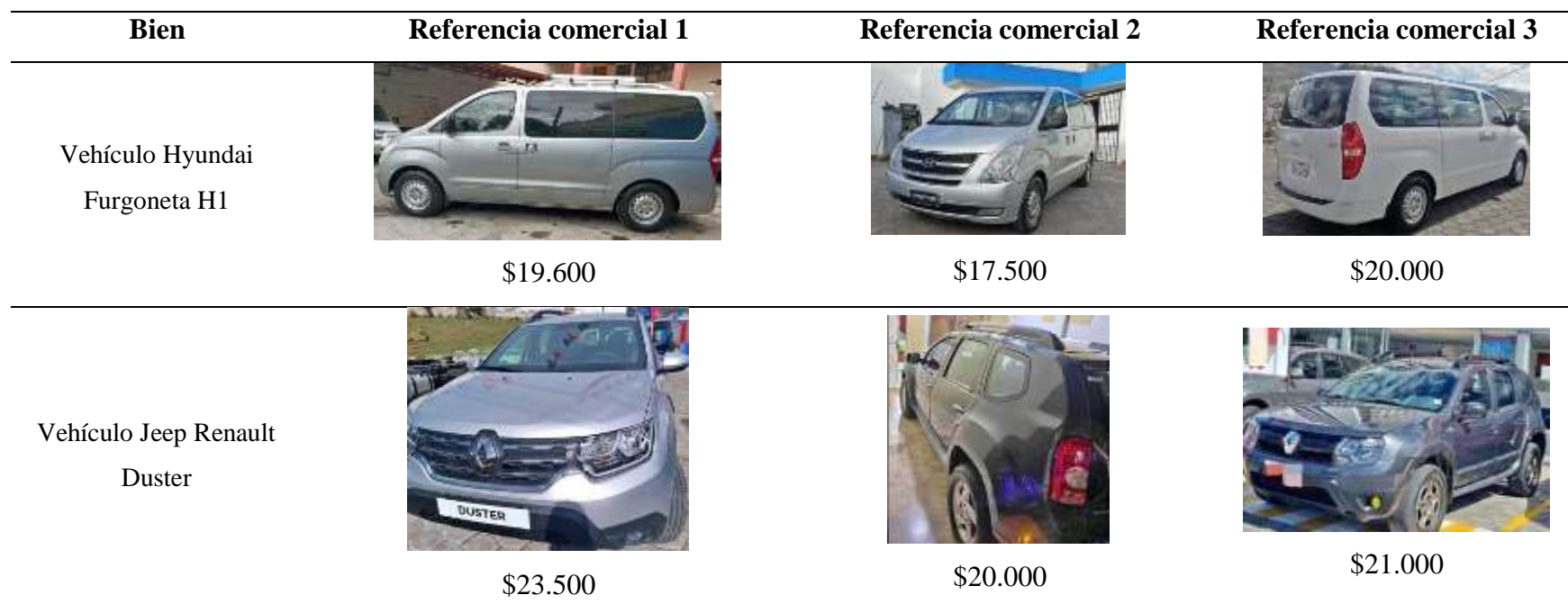
Tabla 15 Medición a valor razonable de los vehículos