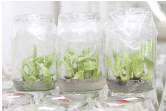
Figura 3. Meristemos de banano

Fuente: Orange Lab. Elaboración: Laboratorios Orange Lab