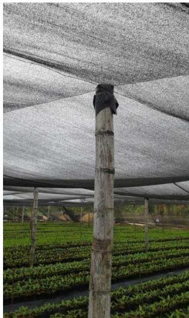
Figura 8. Componentes. Estructurales del vivero Orange Lab

Fuente: Orange Lab. Elaboración: Internado rotativo del autor