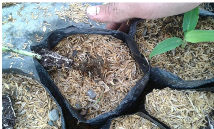
Figura 10. Deshidratación por tacto en el sustrato

Fuente: Orange Lab. Elaboración: Internado rotativo del autor