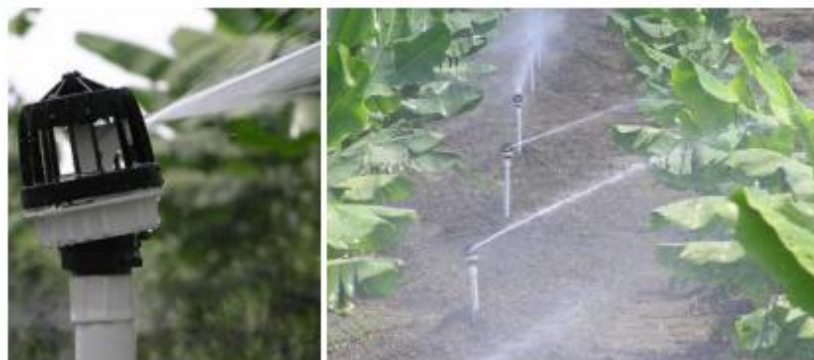
Figura 12. Riego SMOOTH DRIVE™