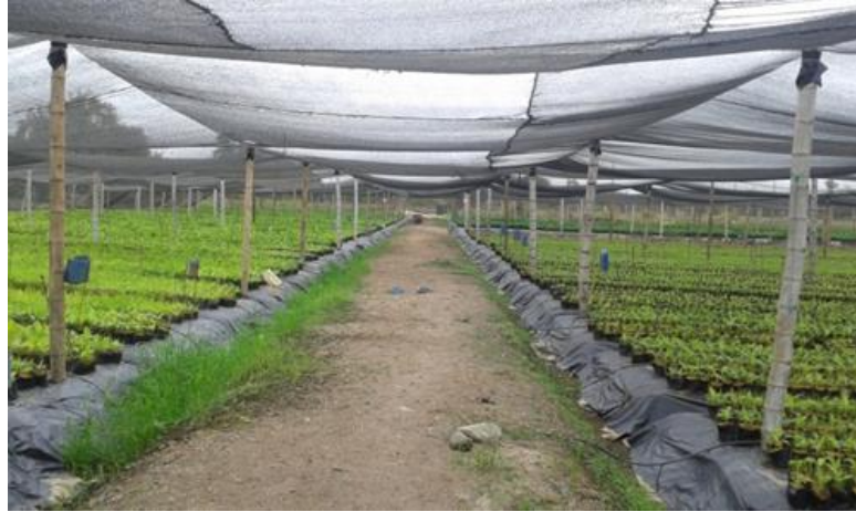
Figura 6. Dimensiones de vivero Orange Lab

Fuente: Orange Lab. Elaboración: Internado rotativo del autor