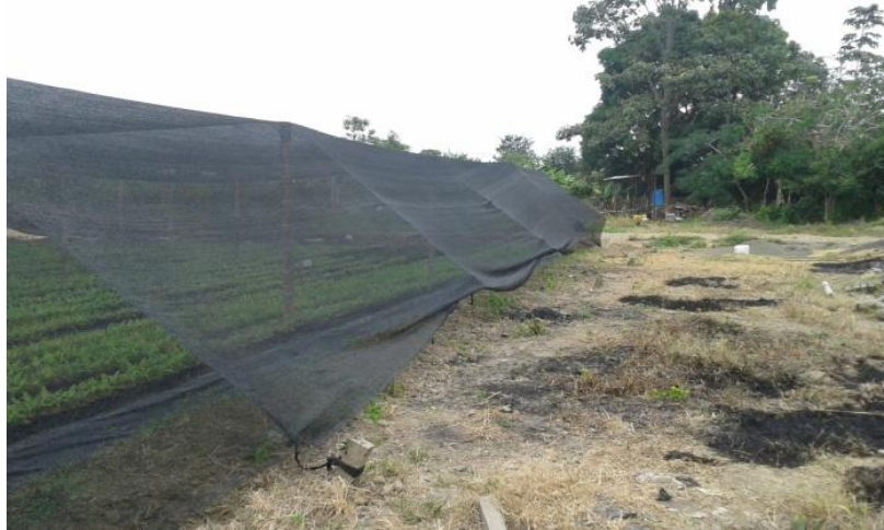
Figura 5. Estructura del vivero Orange Lab

Fuente: Orange Lab. Elaboración: pasantías del autor