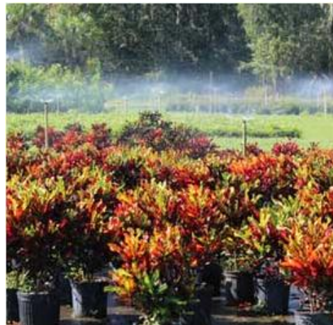
Figura 11. Riego por aspersión en viveros abiertos