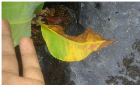
Figura 9. Marchitamiento de las hojas por falta de agua

Fuente: Orange Lab. Elaboración: Internado rotativo del autor