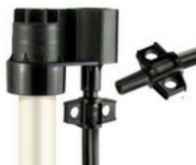
Figura 14. Componente del riego Smooth Drive, Elevador

Fuente: Senninger irrigation inc. Elaboración: Senninger irrigation inc.