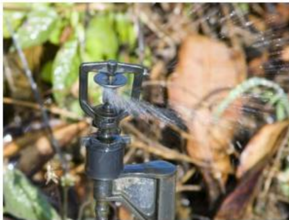
Figura 16. Riego auto compensado Amanco