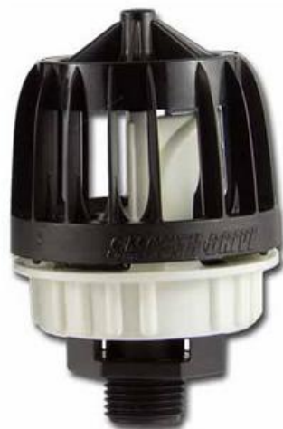
Figura 13. Especificaciones del riego SMOOTH DRIVE™