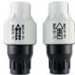
Figura 15. Regulador de presión del riego Smooth-Drive

Fuente: Senninger irrigation inc. Elaboración: Senninger irrigation inc.