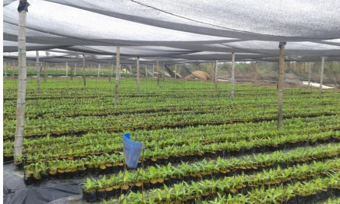
Figura 4. Instalaciones viveros Orange Lab

Fuente: Orange Lab. Elaboración: pasantías del autor