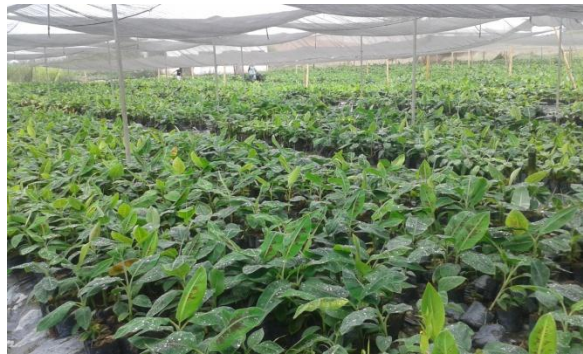
Figura 7. Plantaciones de meristemos de banano en el vivero Orange Lab

Fuente: Orange Lab. Elaboración: Internado rotativo del autor