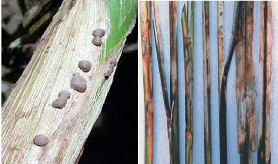
Figura 1: Daños provocados por Rizhoctonia solani en tallos