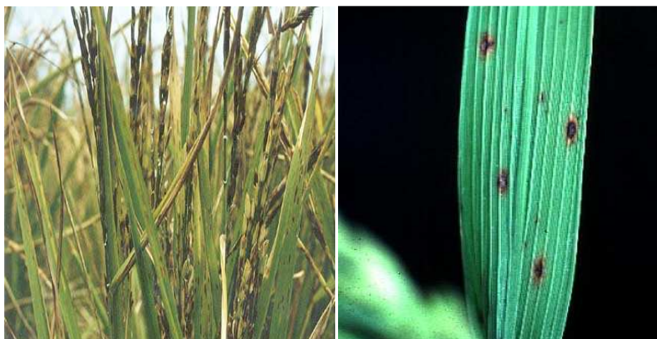
Figura3: Daños provocados por Helminthosporium orizae en hojas y en espiga