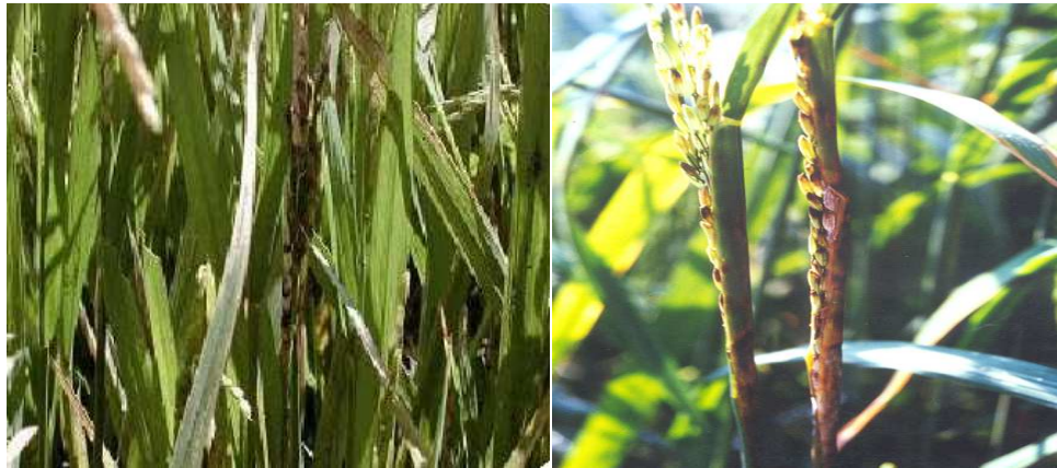
Figura 2: Daños provocados por Sarocladium orizae en cuello de la espiga