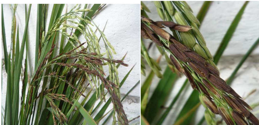
Figura 5: Daños provocados por Burkholderia glumae en la espiga