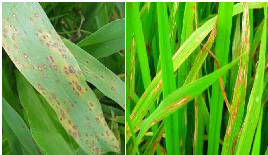
Figura4: Daños provocados por Pyricularia en hojas