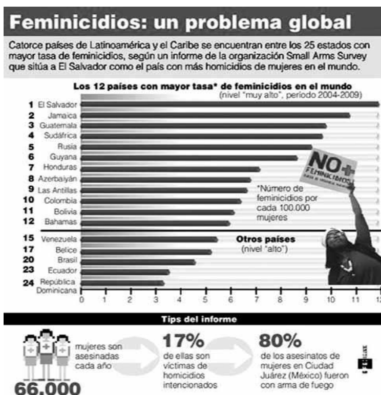
Grafico # 1

El debate sobre el delito de femicidio en la región ha girado en torno a las implicaciones de su tipificación para el sistema de justicia penal, en la importancia de visibilizar el asesinato de mujeres por razones de género y sobre todo, ha puesto énfasis en la revictimización de las mujeres dentro del sistema de justicia y en la responsabilidad del Estado por la impunidad y la repetición de los hechos criminales, convirtiéndose el asesinato de mujeres en un crimen de Estado.