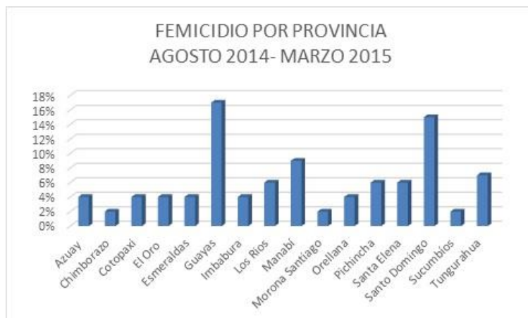
Grafico # 2